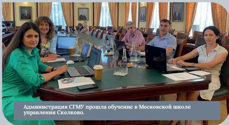
Администрация СГМУ прошла обучение в Московской школе управления Сколково.