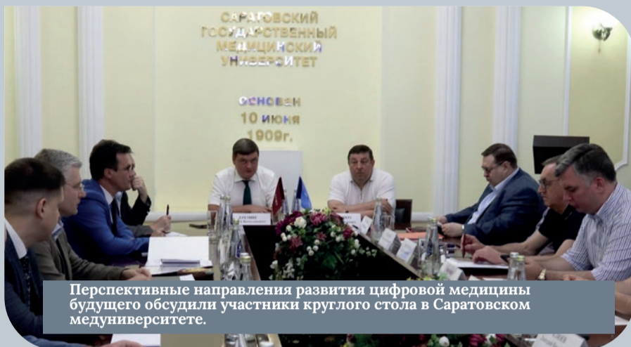
Перспективные направления развития цифровой медицины будущего обсудили участники круглого стола в Саратовском медуниверситете.