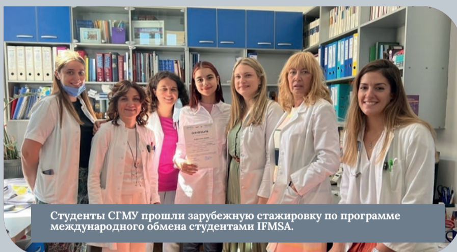
Студенты СГМУ прошли зарубежную стажировку по программе международного обмена студентами IFMSA.