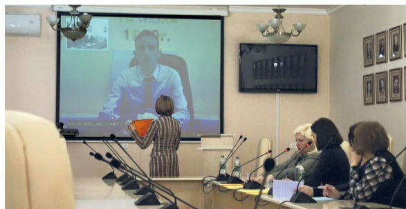
Кафедра русского и латинского языков

Поздравляем победителей и дипломантов! Оргкомитет олимпиады, отметив традиционно высокий уровень языковой подготовки иностранных студентов в СГМУ, пригласил студентов к участию в будущем году во Всероссийском форуме с международным участием «Белые цветы».