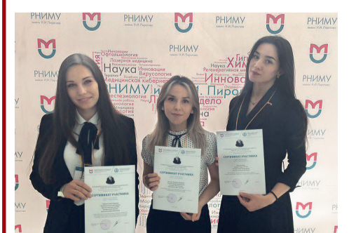
Кафедра глазных болезней