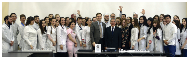
Кафедра стоматологии детского возраста и ортодонтии

Реализация программ академической мобильности в виде обмена преподавателями двух университетов в настоящее время успешно реализуется и будет продолжена в дальнейшем.